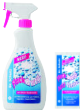
CC-Fleck & Weg beseitigt auch hartnäckige Flecken mit Hilfe von Aktivsauerstoff

Ein Malheur ist schnell passiert – und schnell beseitigt. Denn CC-Fleck & Weg mit Aktivsauerstoff , in der sparsamen Sprühflasche oder als praktisches Tuch, entfernt auch hartnäckige und farbintensive Flecken im Nu.