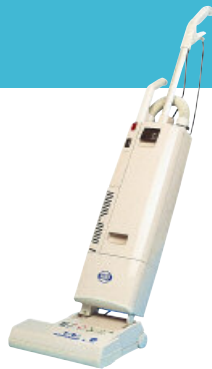
CC-Tebo-Bürstsauger S: Gründliche Reinigung nach dem Verlegen

Bei einer Florhöhe bis zu 20 mm sollten Sie auch hier dem CC Tebo-Bürstsauger S die Arbeit überlassen, weil er besonders schnell und mühelos für Sauberkeit und Frische sorgt.